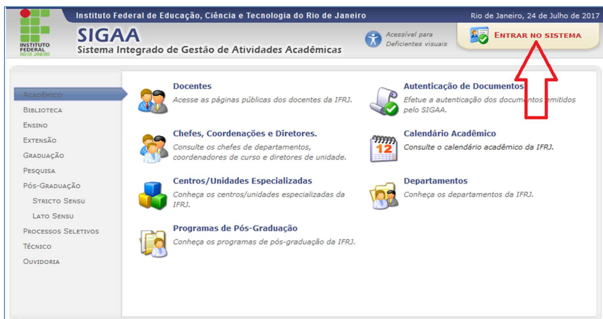
Figura 1 - Portal Público do SIGAA

Para o primeiro acesso ao sistema, o servidor deve realizar um cadastro inicial. O formulário de cadastro está disponível em link na tela inicial do Sistema SIG acessado por meio do Portal Público do SIGAA através do endereço https://sigaa.ifrj.edu.br/sigaa/public .