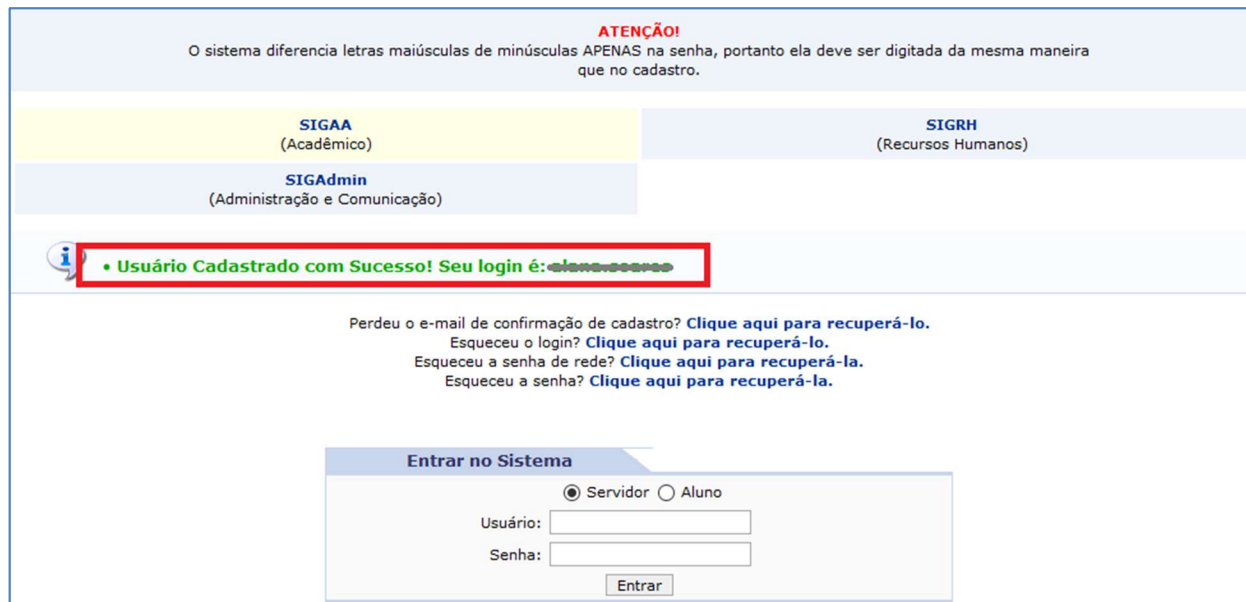
Figura 11 - Mensagem com o Login do usuário gerado pelo sistema SIG

Ao clicar em Cadastrar o sistema irá gerar o seu login de acesso e exibirá na tela inicial, como na imagem a baixo.